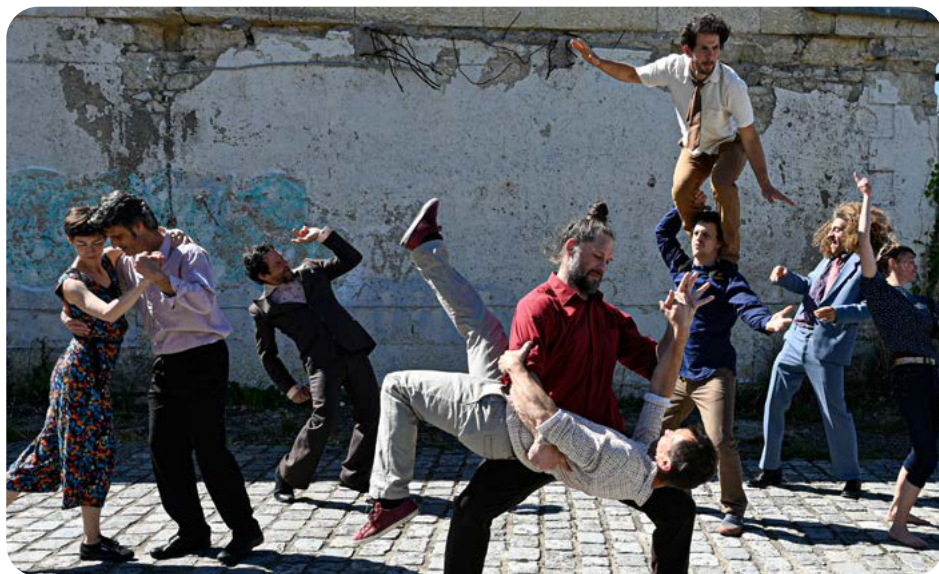
Cie Le Doux Supplice en résidence au CIRC en avril 2021

Dans ses missions premières, Circa accompagne au plus près la création circassienne.