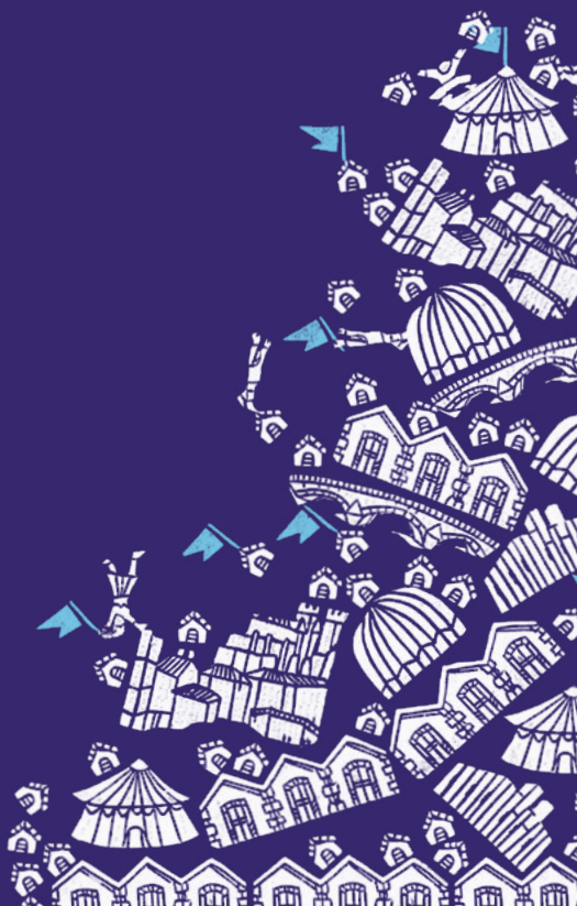
Illustration et typographie Elza Lacotte

CIRC - Allée des Arts - 32000 Auch Informations 05 62 61 65 00 www.circa.auch.fr