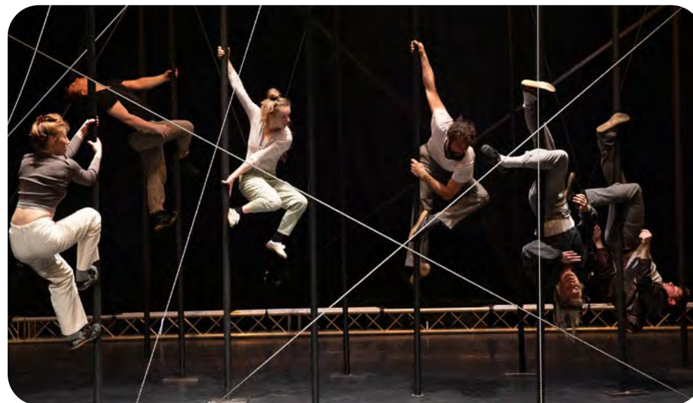
Collectif sous le manteau