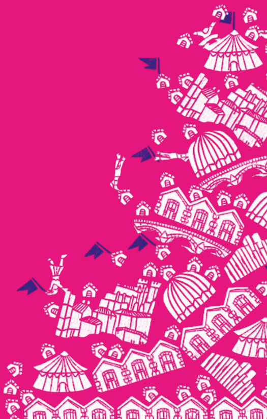
Illustration et typographie Elza Lacotte

CIRC - Allée des Arts - 32000 Auch Informations 05 62 61 65 00 www.circa.auch.fr