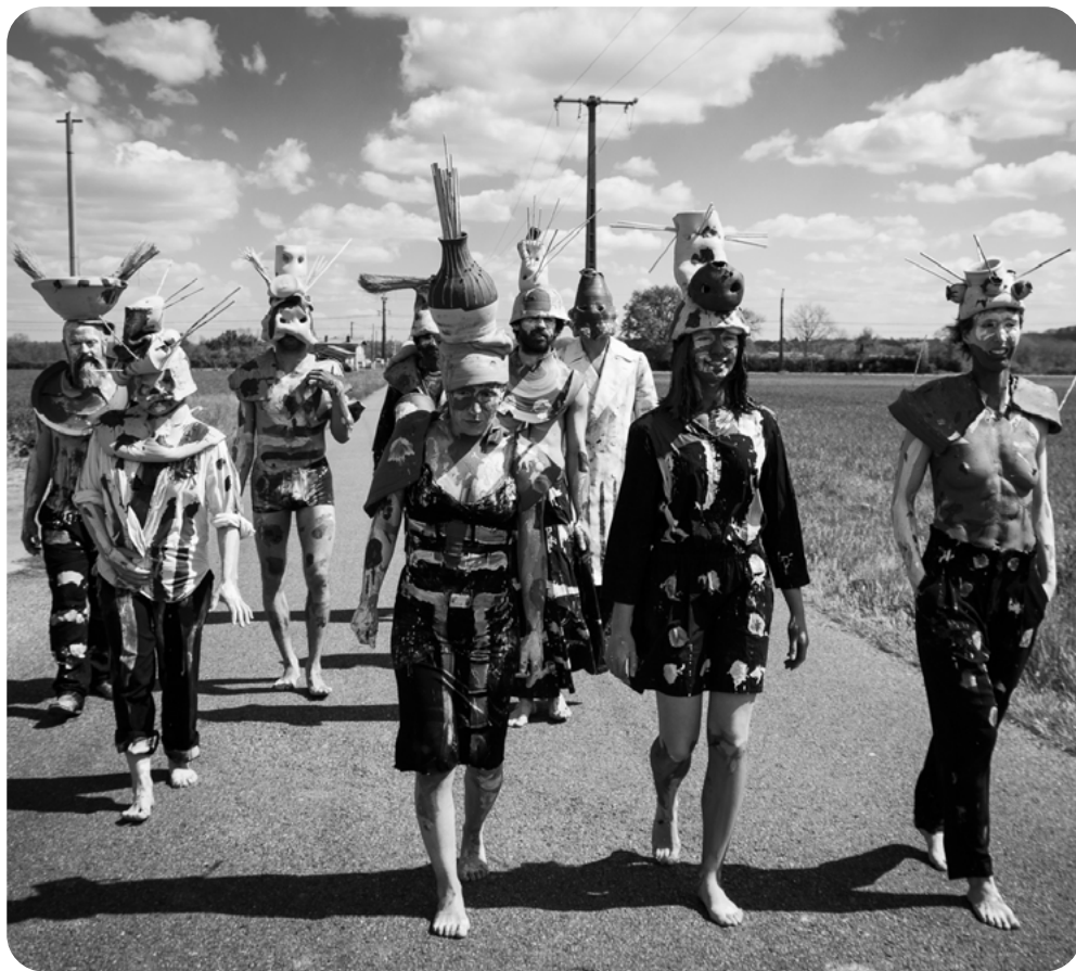
Baro d'evol

Très régulièrement, les compagnies proposent, à l'issue de leur temps de création, des sorties de résidence, moments privilégiés pour découvrir le travail en cours des artistes.