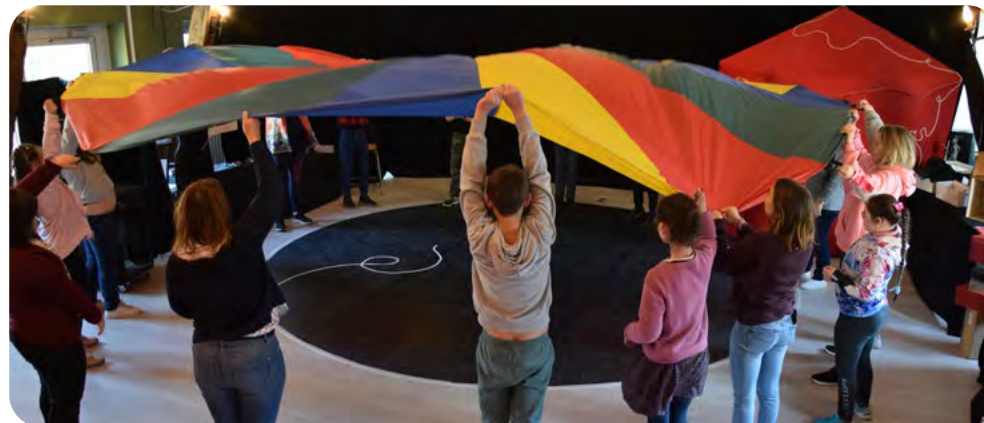
Projet «Cirk&motion» - IME Matalin / avril 2022

Projet réalisé avec le soutien de l'ARS et de la DRAC Occitanie dans le cadre du dispositif Culture/Santé/Dépendance et Handicap.